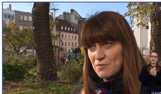
hlavné správy TA3 28. 11. 2021

-legislatívnych komisií. Veríme, že vzájomná diskusia pomôže v navrhovanom paragrafovom znení odstrániť prípadné nejasnosti a výsledkom bude právna úprava jasnejšia a zrozumiteľnejšia pre všetkých podnikateľov.