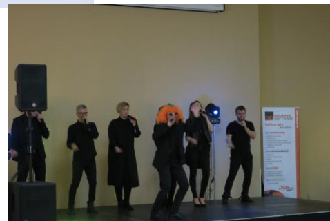
Fotogaléria z MD SKDP